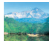
太陽の日差しと眩しい木々の輝き、そして自然の薫りが疲れた心や身体をリフレッシュ。