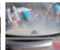
お客様感謝デー3,000食の大鍋で、裏磐梯で採れたきのこや高原野菜をたくさん入れたきのこ汁は美味しいですよ。