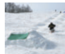
様々なウィンタースポーツが楽しめるのも、裏磐梯ならではの魅力です。