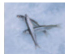
松原湖・小野川湖では「穴釣り」を楽しむ事が出来ます。釣りたてのワカサギは唐揚げにするのがオススメです。