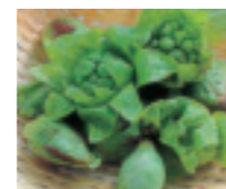
少し遅い春ですが、芽吹きと共に収穫する山菜も豊富です。