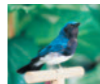
多くの動植物と触れ合える自然豊かな裏磐梯。