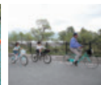
清々しい風を感じながら、松原湖をサイクリング。自然に触れ合いながらのハイキングも楽しめます。