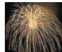
裏磐梯火の山まつり夏の夜、満天の星空の下、沢山の美しい花火を打ち上げます。