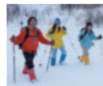
クロスカントリースキーとスノーシューを楽しみながら、雪化粧に染まる自然を満喫。