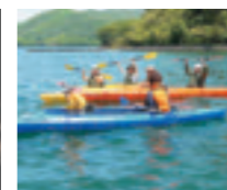
湖や川から見る裏磐梯の風景も最高です。カヌーでゆっくりと豊かな自然を感じてください。