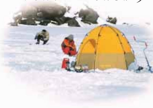
磐梯山北壁のイエローホール(氷瀑)

裏磐梯高原にある湖は冬の期間氷結し、小さな子供からお年寄りまで、氷上で氷に穴を開けて糸をたれ、わかさぎ穴釣りが楽しめます。冬の湖を見ると色とりどりのテントが点在し、穴釣りを楽しめます。